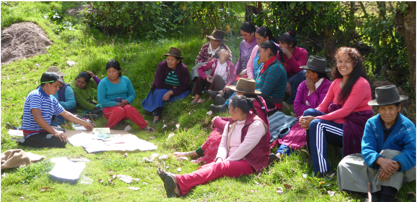
Grupos focales y ejercicios de priorización con mujeres para documentar sus conocimientos y preferencias sobre los árboles y los arbustos de sus comunidades.

El manejo de árboles y arbustos en los paisajes agrícolas tiene un gran potencial para la adaptación de los pequeños agricultores andinos al cambio climático. Actualmente existe una gran diversidad de prácticas y especies agroforestales. También hay una gran riqueza de conocimientos locales sobre las funciones agroecológicas de estos árboles. Sin embargo, en el marco de la planificación de medidas adaptativas, la investigación científica es necesaria para analizar la idoneidad de las prácticas agroforestales en contextos socio-ecológicos determinados. El diseño de estas acciones debe hacerse de forma participativa e inclusiva, considerando aspectos de género y las preferencias de los pequeños agricultores.