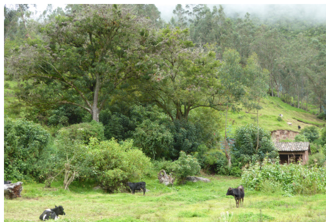
En primer plano: árboles nativos integrados en un sistema silvopastoril; en segundo plano: plantaciones con eucalipto para el uso de la madera y leña.

La documentación y el análisis de los conocimientos locales sobre agroforestería son de gran utilidad, en particular dada la falta de estudios científicos sobre el tema. Para complementar estos conocimientos locales existentes, se recomienda la realización de estudios científicos especializados (p.ej. en el caso presentado, para identificar plantas leñosas que puedan ser usadas para proteger los cultivos contra los eventos climáticos extremos). De esta manera, la combinación de estos dos tipos de conocimientos permitirá la identificación de soluciones innovadoras a los nuevos retos que enfrentan los pequeños agricultores debido al cambio climático.